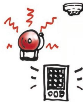
自動火災報知設備