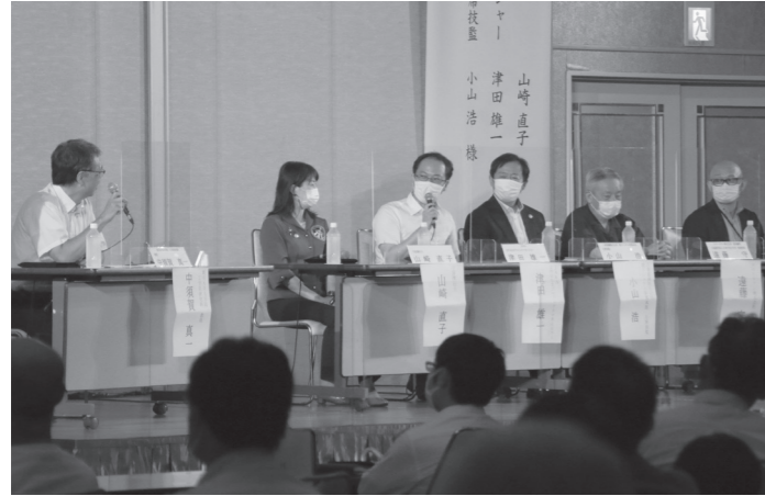
パネルディスカッションで意見を交換し合う様子