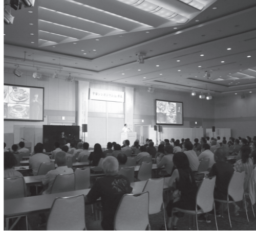
宇宙シンポジウム in 串本の会場の様子