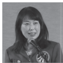
宇宙飛行士 山崎 直子 さん

「射場はおおむね完成し、小型ロケット「カイロス」はシステム試験段階。今後世界から多くの方が串本を訪れる。宇宙スポットという新たな魅力を付け加えることができるはず。地域の方々と一緒に盛り上げていきたいです」