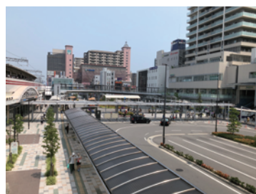
駅前広場の計画・整備(明石市)