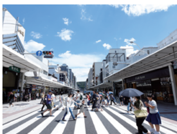
四条通歩道拡幅(京都市)