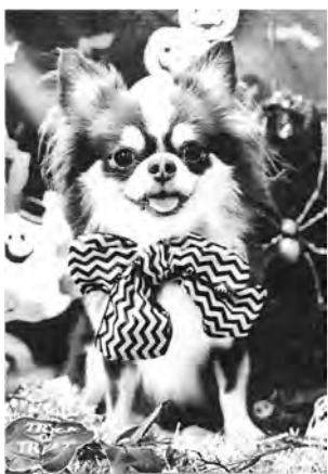
ハロウインのモカ