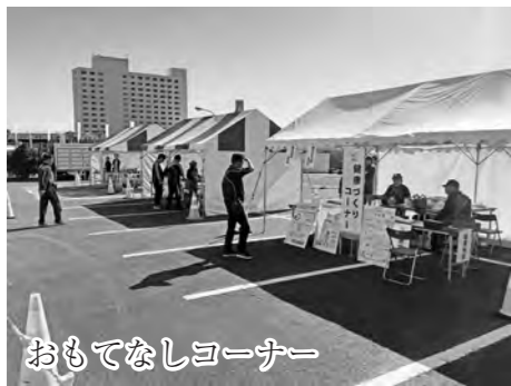
おもてなしコーナー

串本会場では各日8試合ずつの全16試合を行う予定でしたが、大雨のため一部の試合は中止となりました。出場した選手たちは、高齢にも関わらず、スピード感溢れるプレイを繰り広げていました。