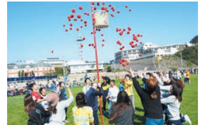
第1日曜日 町民大運動会

国指定名勝天然記念物の橋杭岩をライトアップすることで、幻想的な雰囲気醸し出され、普段とは違った橋杭岩を見ることができます。