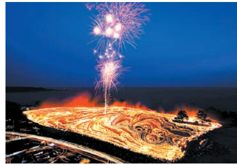
1月 本州最南端の 火祭り 最終土曜日

潮岬望楼の芝にて開催される芝焼き。約10万平方メートルの芝を焼き尽くす炎を撮影するために、毎年多くのアマチュアカメラマンが訪れます。この行事には、枯れた芝を焼くことで害虫を駆除し新芽の育成を促すという目的があります。