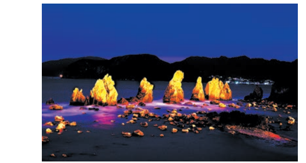
11月 橋杭岩ライトアップ 初旬

古座地区の名産品の販売、各種模擬店が出店し、子どもからお年寄りまで楽しめるイベントです。