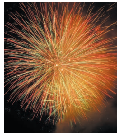
8月 串本まつり(花火大会) 第1土曜日

夏の風物詩として、多くの町民が参加し行われる串本まつり。伝統の串本節おどりや花火大会など、町全体がお祭りムードに包まれます。