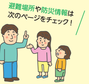
避難場所や防災情報は次のページをチェック！