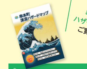
詳しくは、串本町津波ハザードマップをご覧ください