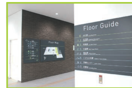
◀わかりやすいフロアガイド