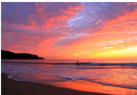
幻想的な風景(海岸)