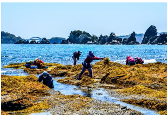
伝統文化や人の賑わい