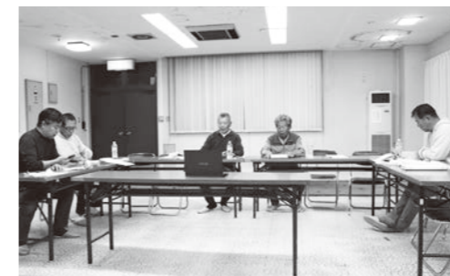
配信用パソコンを囲んで行われている稽古会の様子（6月半ば頃まで毎週月曜19時に開催し、それ以降は祭当日まで週3日程度に頻度を増やして行う予定）

毎年7月に行われる河内祭の御舟行事で歌われる「御舟謠」の担い手不足の解消に向け、御舟謠保存会では、稽古の様子をオンラインで配信し、全国へ発信する取り組みを始めました。 また、祭に関心のある方に気軽に参加してもらえよう、毎週月曜の午後7時から古座漁村センターで稽古会を開催しています。 参加にあたっては事前の連絡は不要で、見学のみの参加も受け付けています。