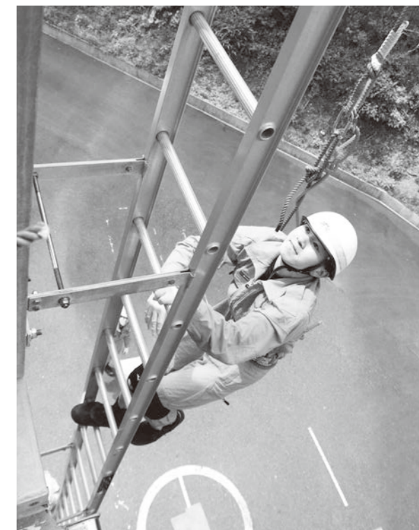
はしご登はんの様子