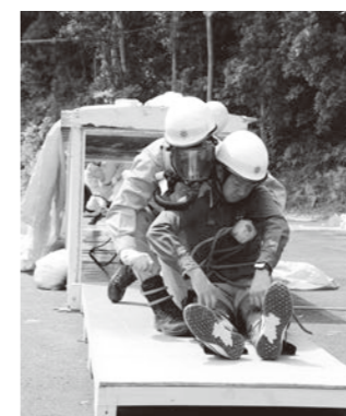
ほふく救出の様子

た選考会であった。昨年はあと一歩及ばず優勝を逃したため、今年はその悔しさを糧に、上位入賞を目指したい」と期待を寄せました。