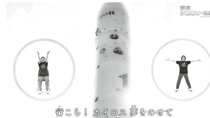
行こう！カイロス夢をのせて ロケット体操の動画（イメージ）

4月に完成した串本カイロスロケット体操の動画を、町のHPで公開しています。メイキング映像とあわせて、お楽しみください。