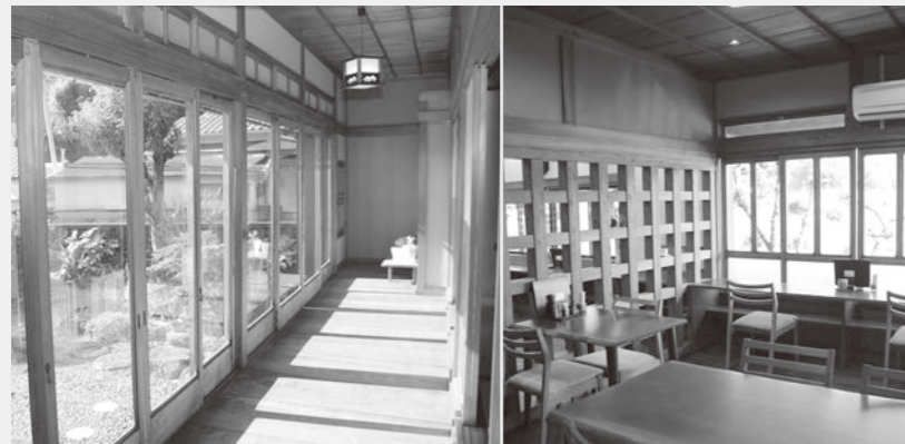
「国土の歴史的景観に寄与しているもの」として登録された旧谷畑家住宅主屋

▼登録有形文化財（建造物） 平成8年に導入された「文化財登録制度」により、保存や活用の必要があるものとして文部科学大臣が登録した建造物をいいます。建設後50年以上が経過し、「国土の歴史的景観に寄与しているもの」、「造形の規範となっているもの」、「再現することが容易でないもの」のいずれかの基準を満たしているものが登録の対象となります。修繕や改築の自由度が高いことが特徴で、届出制の緩やかな規制により保存を図りながら、まちづくりや観光の資源などとして活用されることが期待されています。 ▼旧谷畑家住宅（こざがわ）主屋 古座川の河口に位置し、かつて当地で材木商を営んだ谷畑家の住宅として、昭和29年に建設されました。西と北東に平屋が張り出した木造二階建てで、良材を使用した丁寧な造作を誇る近代和風住宅です。庭や川に面する東・南面にはガラス戸が設けられ、目前に流れる清流古座川の美しい眺望を楽しむことができます。 平成29年6月に、社会福祉法人和歌山県福祉事業団が旧谷畑家住宅主屋を購入。改修を経て、平成31年4月より障害のある方の就労施設として活用されています。