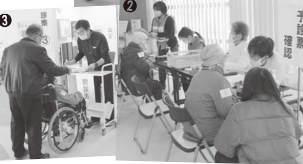
①受付後の待ち合いの様子 ②聞き取りし予診票を確認する様子 ③接種前の診察会場の様子