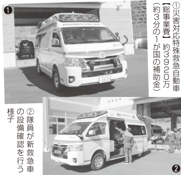
①災害対応特殊救急自動車 【総事業費】約3920万 （約3分の1が国の補助金）