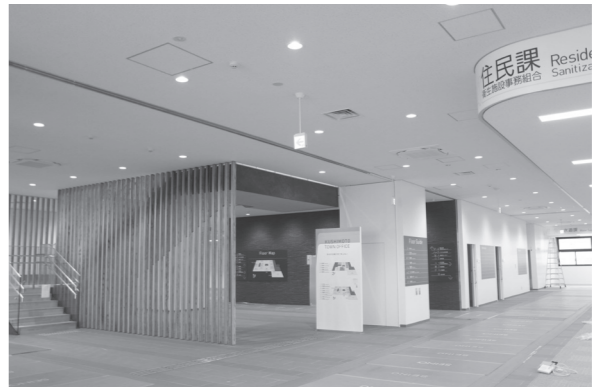
エントランスホールと1階待合（住民課窓口前）

新庁舎は、敷地面積13,339.33㎡、延床面積5,442.32㎡（庁舎棟）の2階建て。本庁舎、古座分庁舎、文化センター、地域保健福祉センター等に分散している各行政部門が新庁舎内に集約されます。