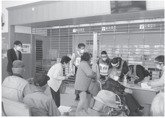
午前9時からワクチン接種の受付開始

串本町では、年齢の高い方から接種を行うこととしており、今回の接種では、申込者のうちの102歳～88歳の一部の方が対象となりました。当日の混雑を避けるための対策として、接種時間を30分ごとに区切り、対象者へ通知事前訓練での課題も踏まえた体制で集団接種に臨みました。