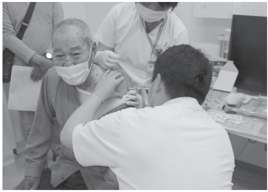
問診後にワクチン接種を受ける男性

接種を受けた女性は、「遠方にいる家族といつか会うためにも、心配させないよう受けようと思った。もつと混雑するかと思っただが早く打つことができて良かった」と話していました。