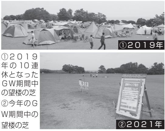
①2019年の10連休となったGW期間中の望楼の芝 ②今年のGW期間中の望楼の芝

東京、大阪、京都、兵庫の4都府県において緊急事態宣言が発令されるなか迎えた今年のゴールデンウィーク（GW）。県内でも不要不急の外出を控えるよう呼びかけるなか、串本町は新型コロナウイルス感染拡大防止のため「潮岬望楼の芝キヤンプ場」を4月28日より臨時閉鎖しました。例年、利用者が賑わう芝キヤンプ場。利用者が過去最多となった一昨年のGWですが、昨年同様今年も我慢のGWとなりました。