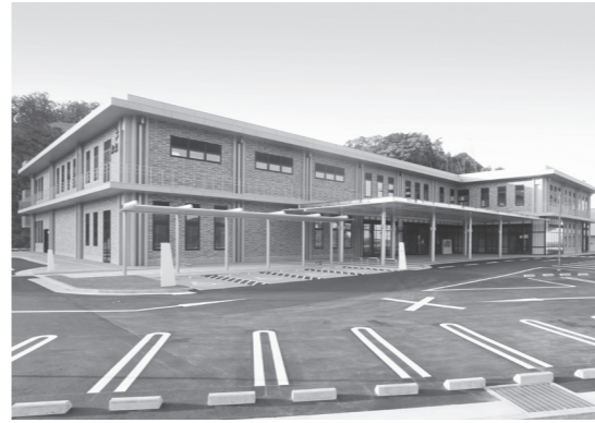
串本町サンゴ台に完成した新庁舎（正面）

串本町役場の現庁舎は、本庁舎本館建物・設備の老朽化やバリアフリーの不備等の問題に加え、海抜の低さから津波被害等が懸念されていきました。高台への移転により、諸問題を改善し、地震・津波等の災害発生時の中枢管理機能を果たすとともに、災害後の復旧・復興の拠点施設となります。