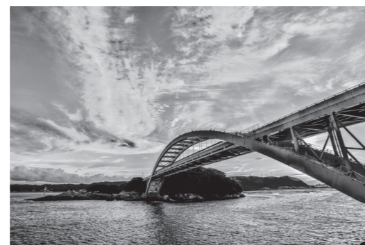
令和2年度グランプリ作品「串本大橋夕景」