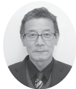
仲江 孝丸 (63) 姫・日本共産党 政党役員⑤