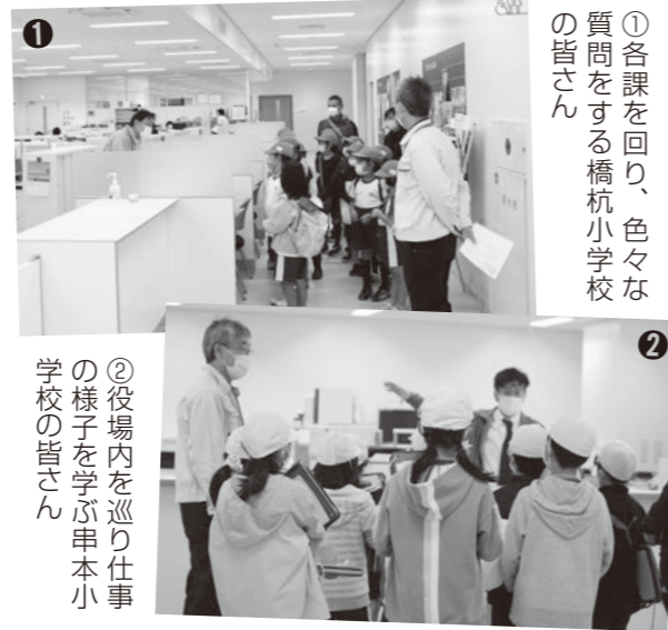
①各課を回り、色々な質問をする橋杭小学校の皆さん

10月19日に橋杭小学校2・3年生の皆さんが、11月12日には串本小学校3年生の皆さんが、串本町役場の見学に来てくれました。職員のガイドのもと新庁舎内を回り、各課でどういった仕事をしているのか説明を受けた児童の皆さん。「道路の白線はなんで光るんですか？」や「どうやったら観光客が増えるんですか？」など活発に質問してくれました。見学後、児童の皆さんは「車いすの人でも通れるように通路を広くしていた」「役場のことを全然知らなかったので知る機会になった」など感想を話していました。