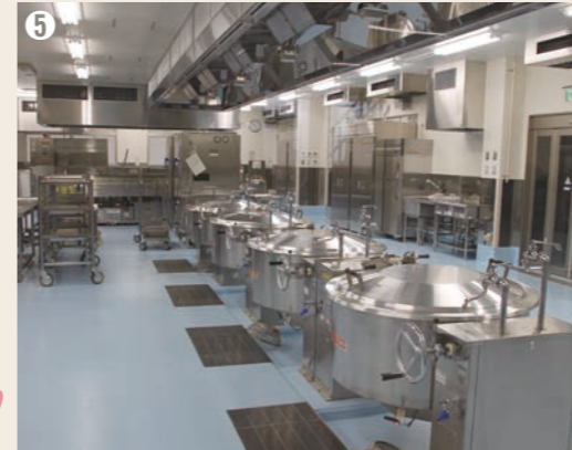
⑤ 平成28年1月8日、串本町学校給食センター竣工式。同月12日より各学校で順次給食の提供が開始されました。

平成27年12月5日、エルトゥールル号遭難事故から始まった奇跡の実話を描いた日本トルコ合作映画「海難1890」が全国ロードショー。同年1月からは、串本町での撮影が行われていました。