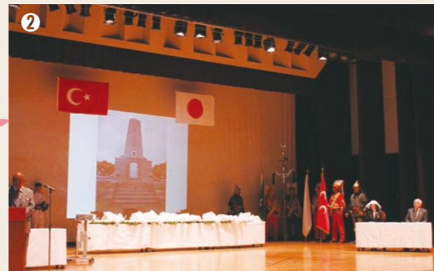
② 平成27年6月2日から4日にかけて、日本トルコ友好125周年記念事業挙行。彬子女王殿下、ジェミル・チチェキトルコ共和国大国民議会議長等がご列席くださいました。