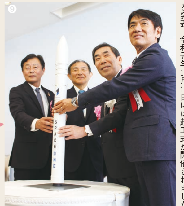
平成31年3月26日、スペースワン株式会社は国内初の民間小型ロケット射場建設予定地に串本町を選定したと発表。令和元年11月16日には起工式が開催されました。