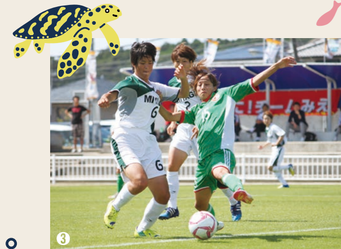
③ 平成27年9月27日から10月4日まで串本町で開催された「紀の国わかやま国体」の3競技。（サッカー、ラグビー、軟式野球）