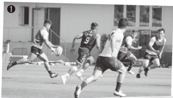
①多目的グラウンドにて練習に励むチームの皆さん ②歓迎セレモニーの様子

10日には南紀串本観光協会主催の「珍魚釣り大会」にも参加し、地域の盛り上がりにも貢献してくれました。