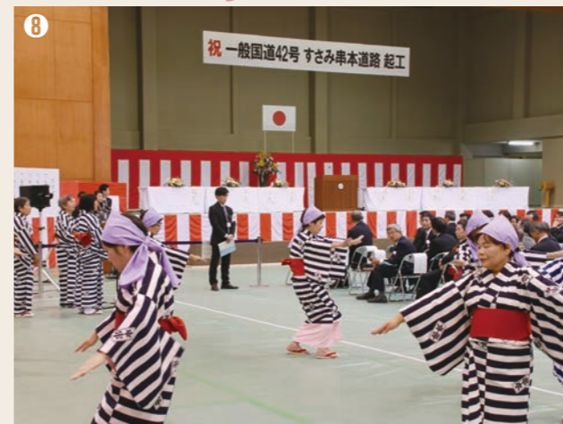
⑧ 平成30年4月15日、串本町サンゴ台と紀勢自動車道すさみ南インターチェンジを結ぶ19.2キロの自動車専用道路「一般国道42号すさみ串本道路」の起工式が開催されました。