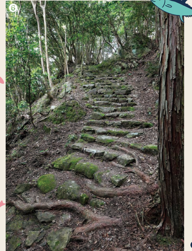
⑥ 平成28年10月24日、新田平見道（写真⑥）、富山平見道、飛渡谷道、清水峠が世界遺産「紀伊山地の霊場と参詣道」に追加登録。