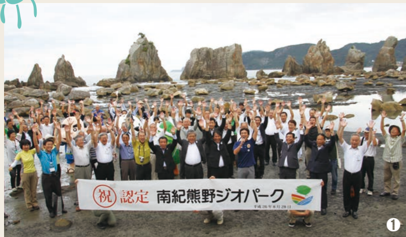
① 平成26年8月28日、国内の貴重な地質遺産として「南紀熊野ジオパーク」が日本ジオパークに認定。平成31年1月18日には再認定を受けました。

平成17年4月1日、旧串本町と旧古座町が合併し、本州最南端に新「串本町」が誕生。平成17年5月号から発行させていただいている「広報くしもと」は、今月号で第200号を迎えました。 今回は、200号を記念して、100号以降の主な出来事を振り返りたいと思います。