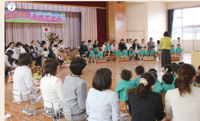
⑦ 平成29年4月5日、認定こども園「くしもとこども園」が開園し、第1回入園式が執り行われました。