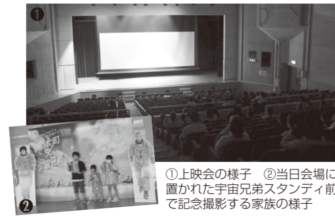
①上映会の様子 ②当日会場に置かれた宇宙兄弟スタンディ前で記念撮影する家族の様子

9月26日、串本町子ども会連絡協議会が、町公式サポーター『宇宙兄弟』の映画観賞会を文化センターで開催しました。子どもたちに、よりロケットに親んでもらうため企画されたこの上映会には、約80名が参加。観賞した小学校4年生の男の子は「とても面白かった。串本でロケットの打ち上げがあるので見てみたい」と話していました。