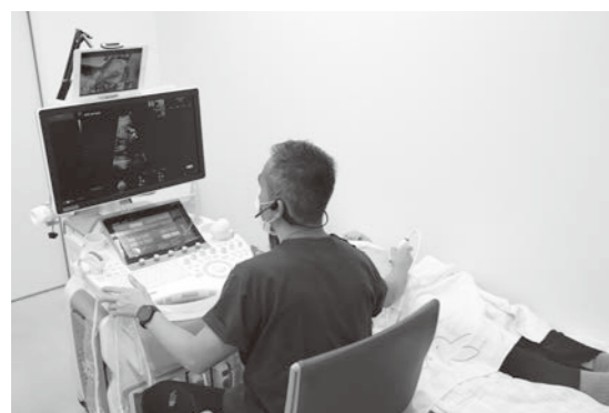
5Gを使い胎児心臓エコーの映像をリアルタイムで伝送し、近畿大学病院専門医から指導を受ける様子

◇お申し込み・お問い合わせ先◇ 和歌山県庁 人権政策課 TEL 073-441-2563 FAX 073-433-4540