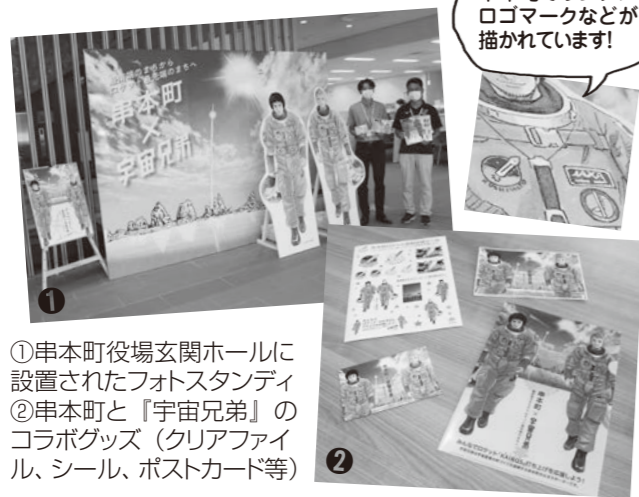
①串本町役場玄関ホールに設置されたフォトスタンディ ②串本町と『宇宙兄弟』のコラボグッズ(クリアファイル、シール、ポストカード等)

串本町では、町全体で宇宙産業の振興をサポートするため、漫画『宇宙兄弟』とコラボレーションし、オリジナルグッズを作成しました。町ロケット推進室は「『宇宙兄弟』グッズを通じて多くの方に宇宙事業や串本町ロケット事業に興味をもっていただき一緒に盛り上げていただければ」と期待を寄せています。*グッズはイベント配布等のみ。一般配布は行いません。