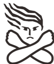
国が定める女性に対する暴力根絶のシンボルマーク

この運動をきっかけとして、人権の擁護と男女共同参画社会の実現に向けて、これらの暴力を容認しない社会づくりをすすめてみましょう。