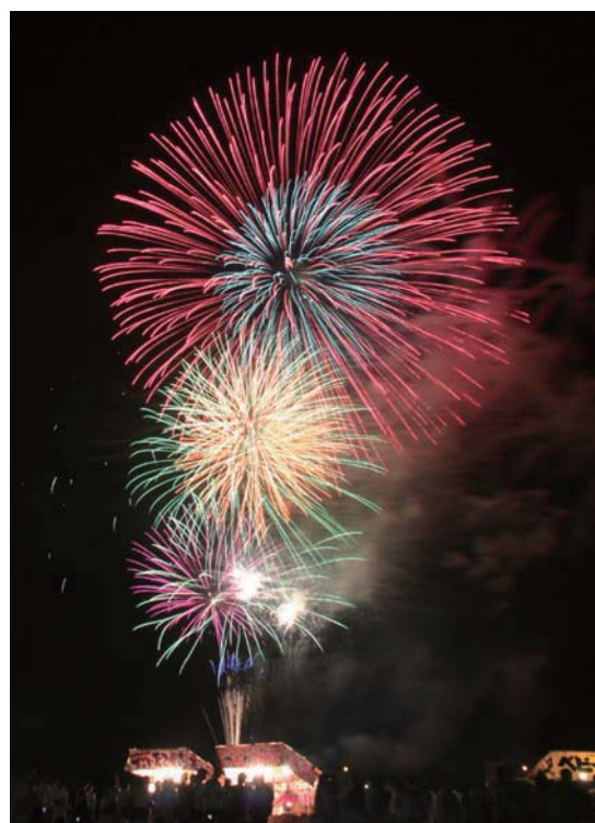
串本まつり花火大会