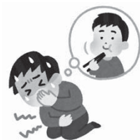
仕出し弁当で食中毒を起こした