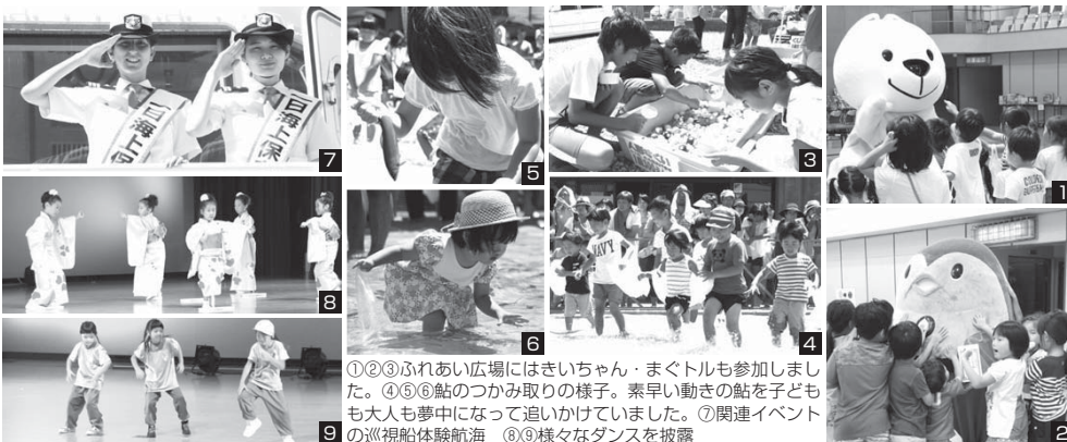
①②③ふれあい広場にはきいちゃん・まぐトルも参加しました。④⑤⑥鮎のつかみ取りの様子。素早い動きの鮎を子どもも大人も夢中になって追いかけていました。⑦関連イベントの巡視船体験航海 ⑧⑨様々なダンスを披露

8月7日、串本町文化センターと町立体育館にて、景品付きのおかしまきや「鮎のつかみ取り」、「ビンゴゲーム大会」などが行われ、終日多くの子どもたちで賑わいました。ダンスでは、フラダンスやヒップホップなど出場者が日頃の練習の成果を披露し、集まった観客からは大きな拍手と声援が送られました。