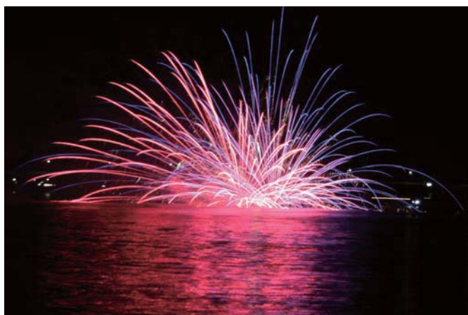
熊野水軍古座河内祭の夕べ花火大会