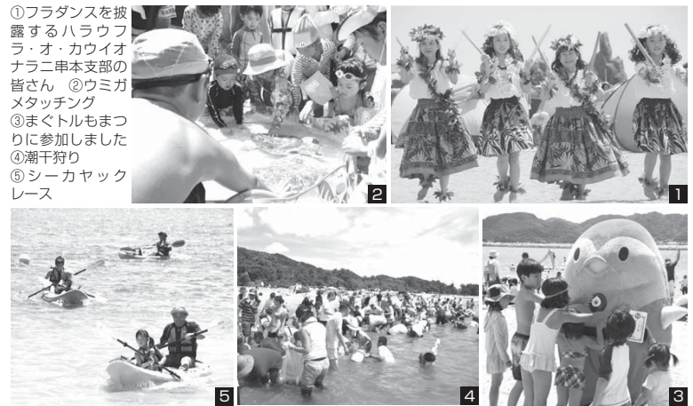
①フラダンスを披露するハラウフラ・オ・カウイオナラニ串本支部の皆さん ②ウミガメタッチング ③まぐトルもまつりに参加しました ④潮干狩り ⑤シーカヤックレース

7月30日、橋杭海水浴場にて「本州最南端の海水浴まつり」が行われました。フラダンスの披露や、潮干狩り、海の家での食券になる宝探し、串本海中公園センターによるウミガメタッチング、今回初となるシーカヤックレースが行われ、多くの参加者で賑わいました。