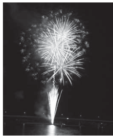
古座川を彩る打ち上げ花火