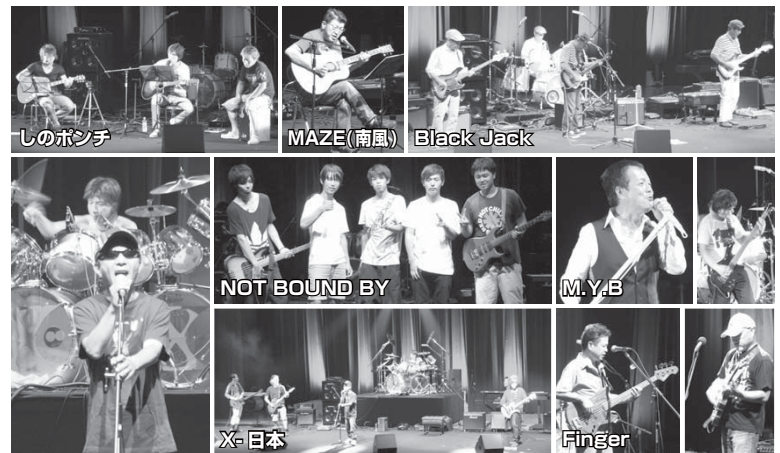
しのポンチ MAZE(南風) Black Jack NOT BOUND BY M.Y.B X-日本 Finger

7月31日、串本町文化センターにてバンドライブが行われました。高校生から選暦を迎えた熟練プレイヤーまで計7組がバンド演奏やギターの弾き語りなど熱演。日ごろの練習の成果を発揮し、熱い歌声や演奏、こだわりの衣装などで観客を盛り上げました。