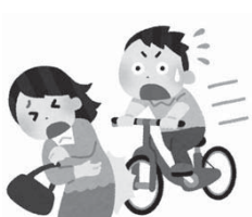
歩いていたら自転車にぶつかられた