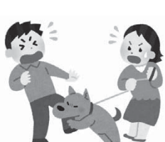
よその飼い犬に噛まれた