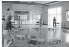
教室の様子(ステップ運動)

運動をするにも1人ではなかなか継続が難しいと思います。そこで仲間と一緒に楽しく運動を始めませんか？以下の地区、日程で「お元気プロジェクト」を行っています。見学からでも構いませんので、ぜひ保健センターまでお問い合わせください。