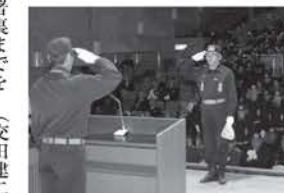
文化センターで行われた消防団員表彰の様子

式典終了後には、参加者全員で文化センターから串本消防署裏までを消防車両とともに分列行進し、最後に串本漁港の岸壁から一斉放水を行い、日ごろの訓練の成果を訪れた住民に披露しました。