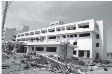
写真② 宮城県南三陸町の4階建ての鉄筋コンクリートビルの被災状況

ないことが証明されました。津波から身を守る為には、絶対に避難する必要があると言えます。次に写真②を見てください。これは宮城県南三陸町の海から数百mほど内陸にある病院が津波によって破壊された様子です。津波はこの鉄筋コンクリートビルの4階まで襲ったそうです。写真だと分かりにくいかもしれませんが、この鉄筋コンクリートビルもかなり破壊されています。海から近い所にある場合は、鉄筋コンクリート造りといえども、完全に安全とはい切れません。