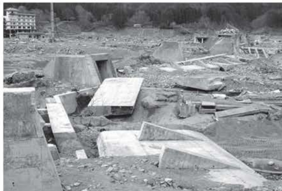
写真① 岩手県宮古市田老地区の10mの防波堤の倒壊の様子

写真①を見てください。これは岩手県宮古市田老地区の「万里の長城」と呼ばれた10mの防波堤が津波によって倒壊している様子です。10mもの防波堤が倒壊した要因はいろいろ考えられています。が、10mを超える津波によって土台の土が洗掘されて破壊されたようです。これだけの高さのあるコンクリート製の堤防が破壊されたのですから津波が持つ破壊力は物凄いものと言えます。したがって、構造物によるハード対策は、津波の力を弱めることは出来ず、完全に街を守ることは出来