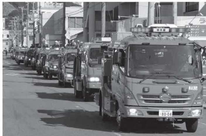
消防団による分列行進

1月8日、串本町文化センターにおいて消防署員、消防団員、樫野婦人防火クラブ員らが出席し、串本町消防出初式が執り行われました。