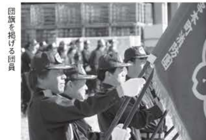
団旗を掲げる団員